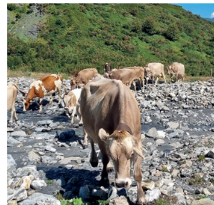
Die Kühe werden über die Rabiusa auf eine frische Weide getrieben

die frische Luft, die Berge, die Flora, die Ruhe, Abgeschlossenheit und die unglaublich schönen Stimmungen am frühen Morgen oder am Abend. Es ist aber auch die Zusammenarbeit mit den Kühen. Obwohl er als Senn vor allem für den Alpbetrieb und die Milchverarbeitung verantwortlich ist, lässt er es sich nicht nehmen, jeden Morgen die rund 80 Tiere von der Weide zu holen, um mit ihnen vor Tagesanbruch im Stall zu sein. Aber auch das Zusammenspiel des Alp-Teams ist für ihn sehr zentral. Nur wenn das Team harmonisiert und etwa den gleichen Humor hat, kann der strenge Alpalldag erfolgreich bewältigt werden.